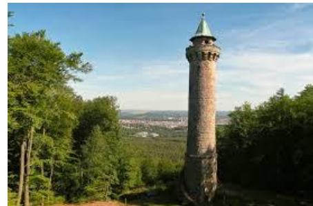
KL Humberturm/ Humbert tower

Haftung: Die Teilnahme erfolgt auf eigenes Risiko. Der Veranstalter übernimmt keine Haftung. Liability: Participation is at your own risk. The organizer assumes no liability.