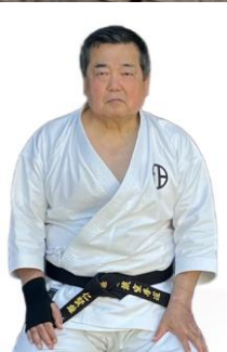
Soke Kenyu Mabuni

in Kaiserslautern (Deutschland/ Germany)