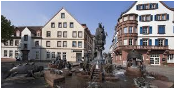
KL Innenstadt/ downtown

We invite you to the traditional Dento Shito Ryu International summer seminar that will be held in Kaiserslautern, surrounded by the beautiful Palatinate Forest. Training sessions will be held in training halls and outdoor.