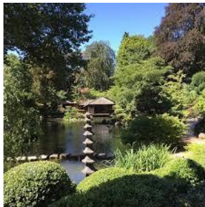
KL Jap. Garten/ Jap. Garden