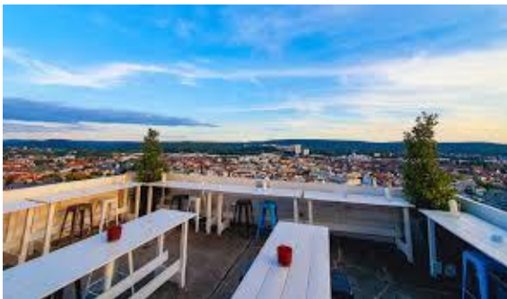
Blick auf KL/ View of KL